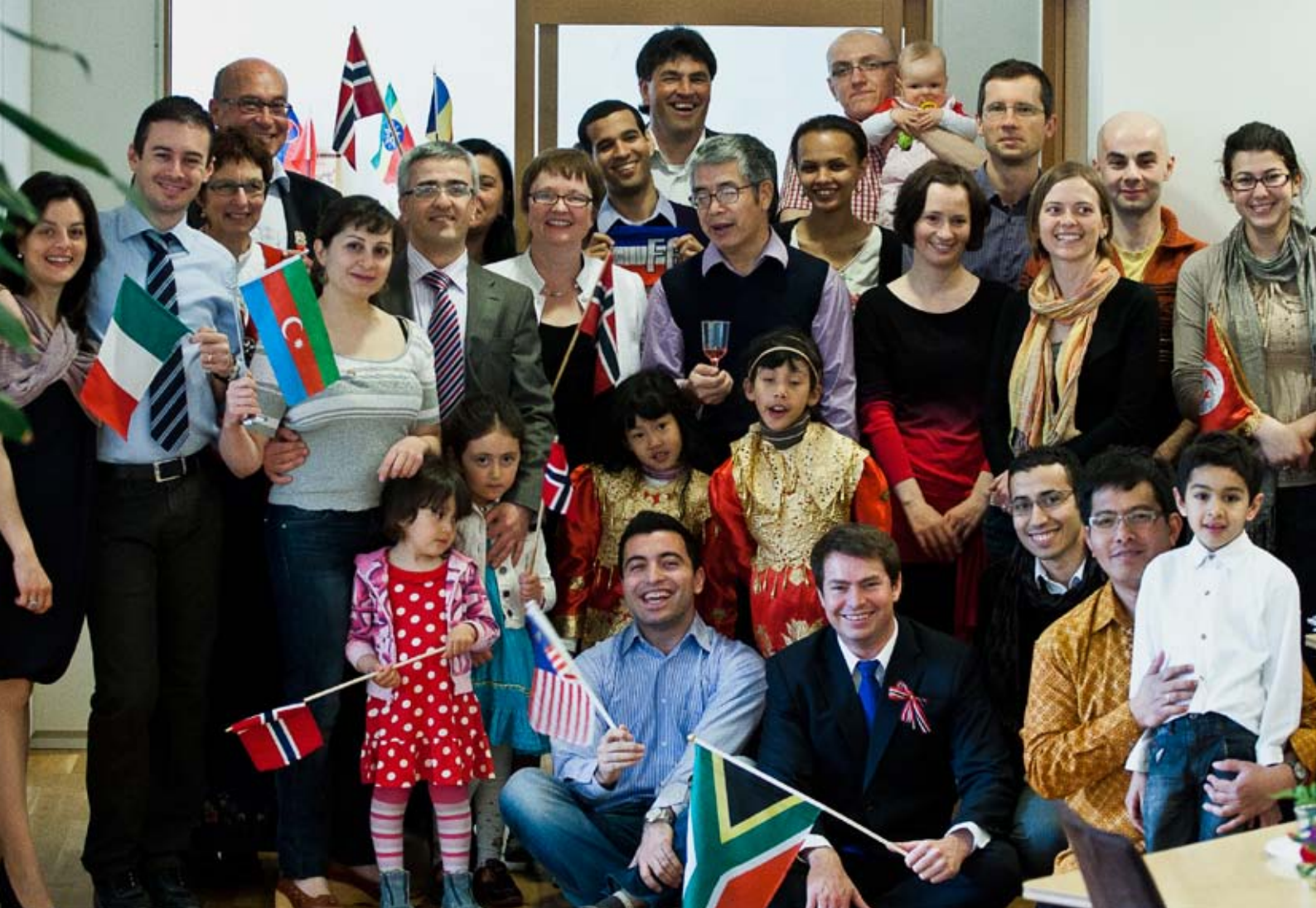
17. mai sørget Expat Mid-Norway for at byens utenlandske arbeidstakere fikk både innsikt i og inntrykk fra nasjonaldagen. Her fra feiringen i selskapets lokaler.